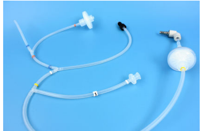
Aus einer Hand: Die fixfertig konfektionierte Schlauchbaugruppe sorgt mit farblichen und numerischen Markierungen für eine sichere und schnelle Montage beim Kunden.

Die Schnittstellen bei den Schlauchsystemen sind entscheidend für die Qualität. Diese sollten frei von Leckagen, „Totwasserstellen“ und starken Durchmesserübergängen sein, bei denen das Medium gesichert oder unnötig verwirbelt wird. Es gibt eine Vielzahl von verschiedenen Kopplungsstandards. Sehr häufig wird im Medizin- und Laborumfeld die Luerverbindung gewählt. Beim Luer-Slip System werden der männliche und weibliche Teil der konischen Verbindung zusammengesteckt. Durch eine Überwurfmutter am männlichen Kegel kann ein unkontrolliertes Lösen der Verbindung verhindert werden. Dieses Luer-Lock System bietet nun die Sicherheit für einen kontrollierten Flüssigkeits- oder Gastransfer.